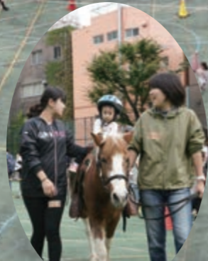
ポニー乗馬コーナー