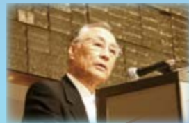
＜主催者挨拶＞ 石川区長