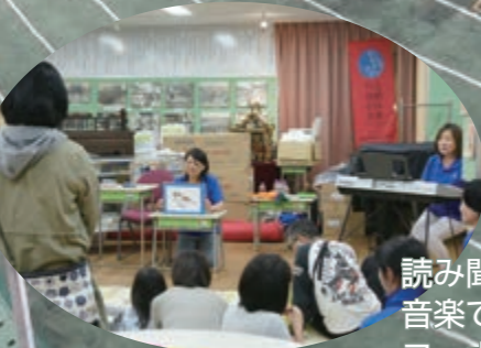
読み聞かせと 音楽で遊ぼう コーナー