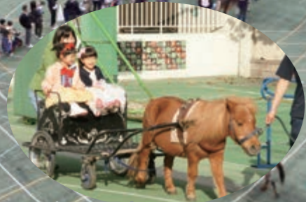
ポニー馬車コーナー (ミニチュアホースあおちゃん)

平成30年10月28日(日) 第10回ポニー乗馬会をお茶の水小学校にて開催しました。天気も良く暖かな日で、300人以上来場した子どもたちも喜んでくれました。校庭では、ポニー乗馬、ポニー馬車、動物ふれあいの各コーナー、校内では読み聞かせ、音楽で遊ぼうを実施しました。