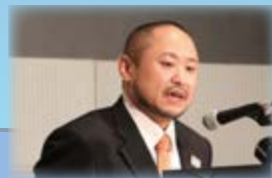
＜講演＞ 柔道家・パラリンピアン 初瀬 勇輔氏