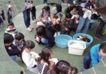
小動物ふれあいコーナー