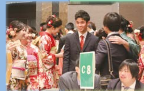
コミュニケーションタイム

マシュマロチャレンジ!! マシュマロ1個とパスタを使いタワーを建てます。 同じテーブルになった人たちと相談しながら高さを競うものです。初対面の人とコミュニケーションをとり共通目的を達成してもらうゲームです。社会に出てから初めて出会う人と仕事をするを想定しています。