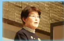
＜来賓挨拶＞ 松本区議会議長